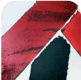
Ausschnitte aus der Reihe „WEGZEICHEN“ des Künstlers Gerd Winner. (Acryl auf Leinwand)